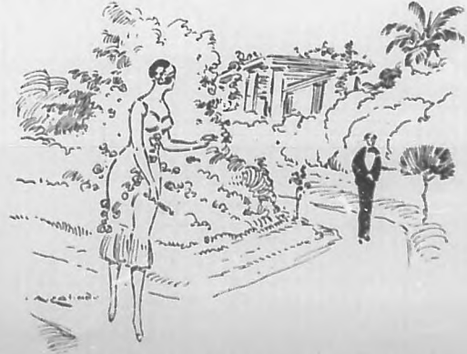
...la mujer joven y bella que estaba cazando a un hombre...

—¿Yo triste? Pues no se me ha muerto nadie. Hasta el gato y el canario los he dejado contentos en casa.