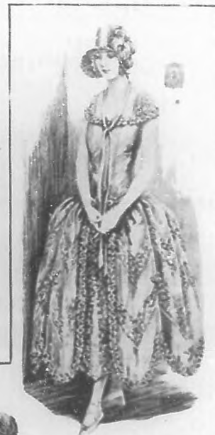
Un traje encantador "Inglés antiguo", en tafetán melocotón y encaje de plata, adornado con flores y risado de cinta.