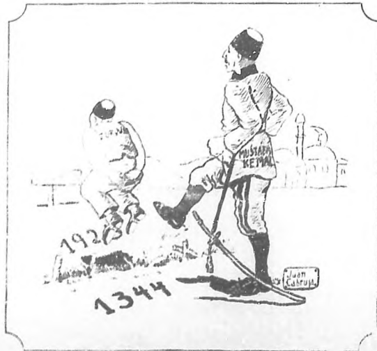
Dibujo de Juan Cabruja.

Si ha puesto a Turquía dando el salto correspondiente, es porque a él se le ocurrió que sólo en esa forma radical se puede conseguir que un pueblo cambie radicalmente de ideas que tienen quinientos ochenta y dos años de retraso.