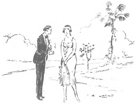
—¿Usted por aquí, señorita Raquel?

—No me diga eso. Usted no es indiscreto conmigo. Lo que sucede es otra cosa. Suponiendo que yo tuviera una pena, verdaderamente, esta noche, ¿qué interés podría tener usted en conocerla? Ninguno, naturalmente. Por eso me guardo muy bien de aburrirlo contándole lo que sufro en una fiesta a la que todos hemos venido a divertirnos.