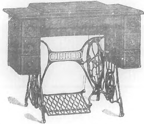
Excelente máquina de coser "Singer", lisa, medio gabinete, con siete gavetas y caja abierta, que será sorteada el presente mes, entre los suscriptores de BOHEMIA.

El recibo agraciado tenía el Número 05207