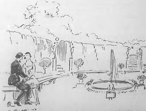
¿Y es posible que sólo del contacto de dos manos sucedan en el mundo tantas cosas?

El artista agregó gravemente: —Es que usted, como yo, señorita, debe haber adivinado cuán difícil ha de ser hallar en la vida, usted, el hombre, y yo, la mujer con quien soñamos, el sér que hemos de amar verdaderamente y que ha de amarnos como nosotros queremos serlo, aunque no sepa-