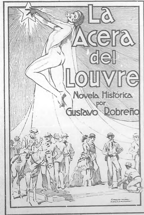
Facsimil de la portada, obra del eminente dibujante E. García Cabrera, de la interesante novela "La Acera del Louvre", que ha sido editada esmeradamente por la casa "Rambla y Souza".

En los primeros tiempos también se efectuaban cantinios duelos y casi todos los que formaban la histórica pódica ofrecieron sus servicios a la Patria. Fueron, pues, los precursors sublimes de nuestro contemporáneos. Uno de los tipos clásicos de la Acera del Louvre fué el general Julio Sanguily. Su figura varonil; su apostura de guerrero, cuando se aparecía a caballo, invitaba a la suprema rebeldía. Sanguily fué el eslabón glorioso de dos generaciones, la fundadora de la leyenda y la continuadora de la tradición. Como Julio Sanguily hubo otros cubanos que caracterizaron el histórico bloque. Entre esos inolvidables, Erwione Hernández Miyares, el poeta de los arranques sublimes, el arriego inseparable de Manuel Sanguily. Otros, los hermanos Mazonra, Pablo y Pedro, se distinguieron también por su nobleza de carácter. Muchos de esos nombres se barajan en el libro, los demás se han olvidado, aunque se esbozan, en estas colectivas, los que el autor juzgó impresionantes para las pocas narraciones