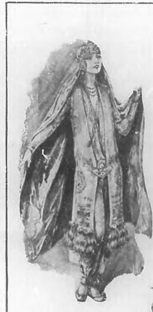
"Traje del Este", de seda rosa, ricamente adornado con perlas, cristales y diamantes.

Recibí su grata, llena de muy buenos propósitos