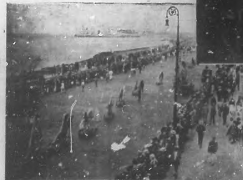
Uno de los aspectos más interesantes de la Cabalgata del Niño, celebrada el día 28 en esta ciudad