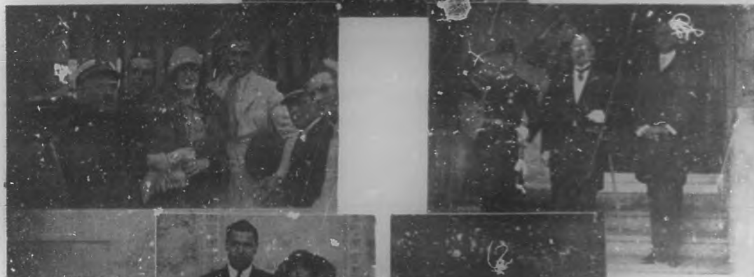
El campeón mundial de boxeo Jack Dempsey y su bella esposa Estelle Taylor, en los momentos de embarcar para los Estados Unidos.

Acaba de ser designado por el honorable señor Presidente de la República, para ocupar el alto cargo de Inspector General de Farmacias, una persona