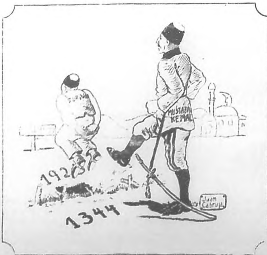
Dibujo de Juan Cabruja.